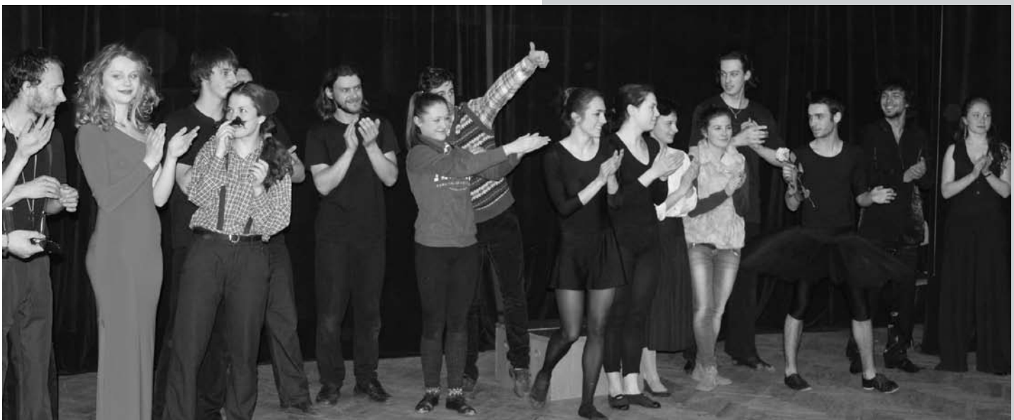
Студенти акторського відділення кафедри театрознавства та акторської майстерності ЛНУ ім. І. Франка вітають глядачів з Міжнародним днем театру, 2014 р.