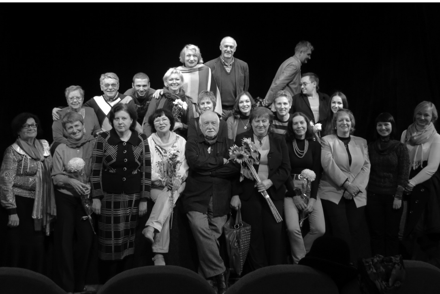
Учасники Міжнародного театального фестивалю жіночих монодрам "Марія", 2012 р.