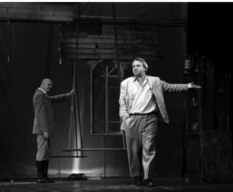
Сцена з вистави “Дядя Ваня” А. Чехова. Режисер – О. Александров, художник – В. Медвідь. Луганський академічний російський театр.

Не викликає сумніву і подальша доля фестивалю під батугою вище названих керівників: дирекція планує проводити його що два роки, у визначенні переможців надається перевага чоловічим номінаціям (ім’я Луспекаєва запорука цього). Фестиваль має на меті зберегти та розвивати традиції репертуарного театру, зміцнювати творчі контакти практиків та теоретиків сцени, сприяти формуванню високої професійної майстерности, налагоджувати творчі зв’язки між театральними колективами.